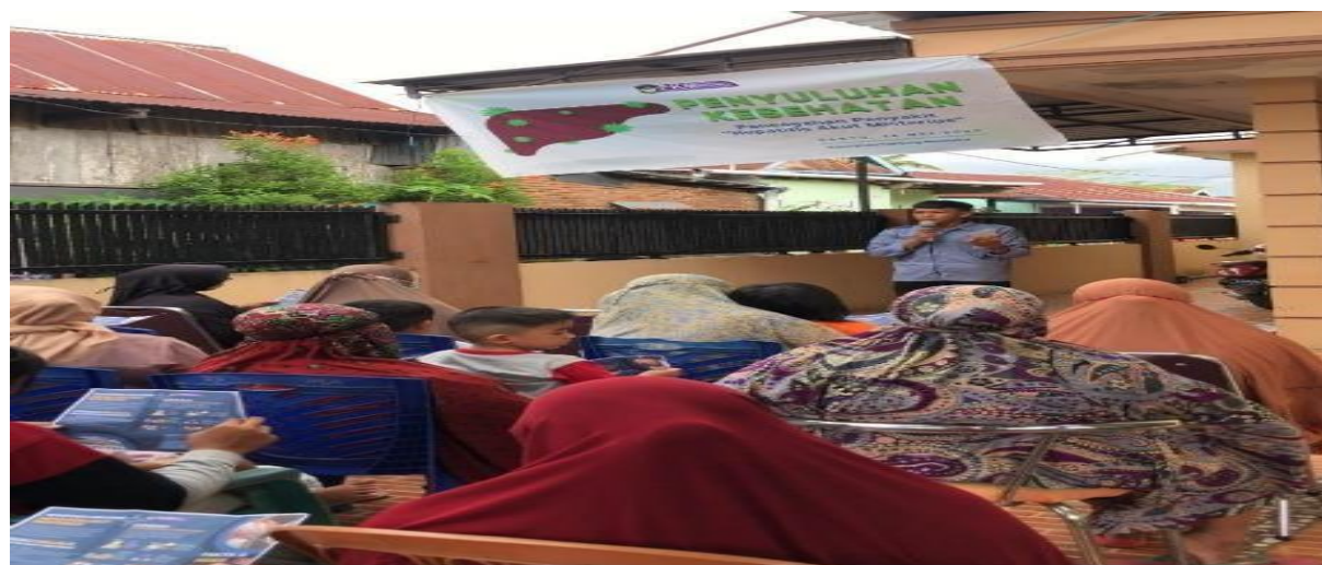
Gambar 1. Pemberian Materi tentang Hepatitis Akut

Dalam hal pemberian edukasi, penyuluh menggunakan metode ceramah. Setelah selesai diberikan penyuluhan selanjutnya warga dibagikan post tes untuk mengukur sejauh mana pemahaman warga terkait hepatitis akut.