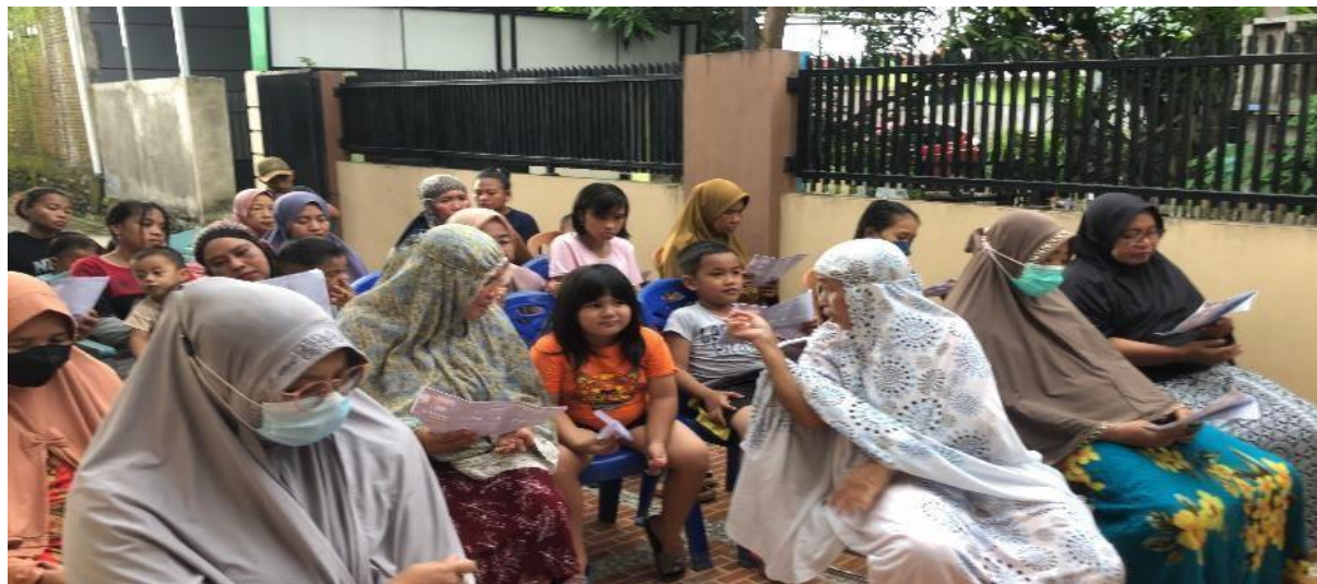
Gambar 2. Pembagian Brosur Kepada Peserta Penyuluhan

serius dan antusias memberikan pertanyaan yang berkaitan dengan hepatitis akut khususnya bagaimana cara pencegahan agar bisa terhindar dari penyakit menular ini.