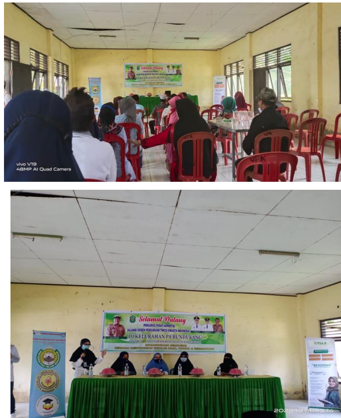
Gambar 1. Penyuluhan kepada masyarakat

Kegiatan evaluasi dilakukan pada bagian akhir rangkaian kegiatan dengan menggali informasi dari peserta sejauh mana informasi tentang PHBS selama pandemic Covid-19 yang dapat di terima oleh peserta.