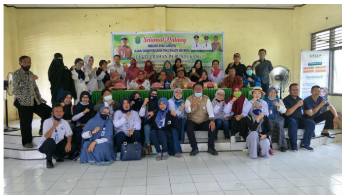
Gambar 2. Foto bersama anggota Adpertisi dan Aparat Kelurahan Pabbundukang

Hasilnya menunjukkan adanya peningkatan pemahaman mengenai PHBS selama pandemic Covid-19 dalam tatanan keluarga, namun tetap harus dilakukan evaluasi intensif terkait bagian mana saja yang sudah dipahami dengan baik dan bagian mana yang masih terkendala dalam pemahaman masyarakat untuk diimplemantasikan lebih lanjut.