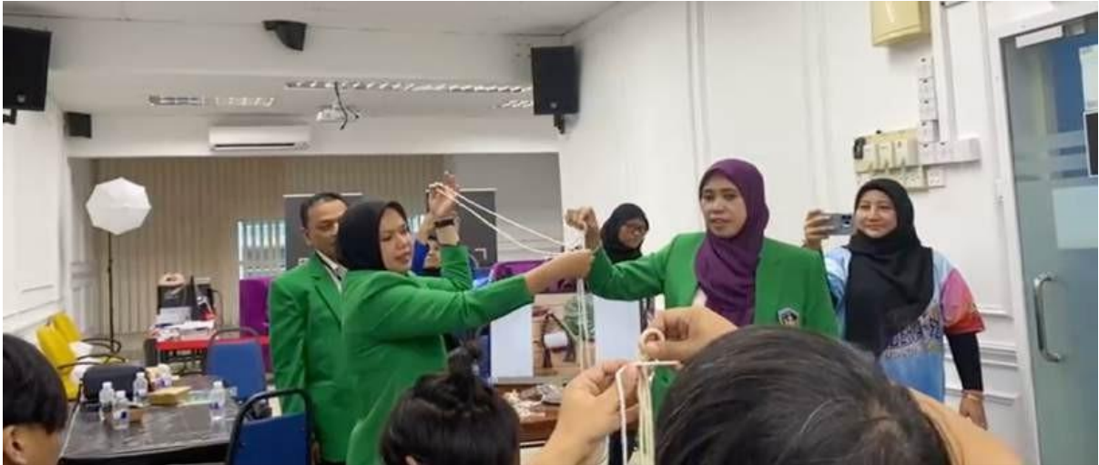
Gambar 2. Edukasi dan pelatihan art based intervention berbasis seni macrame

Dalam sesi pelatihan, peserta diajarkan teknik dasar simpul macrame dan membuat karya sederhana berupa gantungan kunci dan hiasan dinding mini. Semua peserta berhasil menyelesaikan karyanya. Aktivitas ini membantu meningkatkan konsentrasi, kesabaran, serta menumbuhkan rasa bangga akan karya masing-masing.