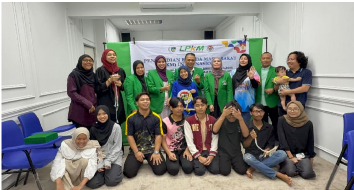
Gambar 3. Foto Bersama dengan remaja dan pengurus BI KNPI Malaysia

Secara kualitatif, peserta merasa lebih tenang, bersemangat, dan percaya diri setelah mengikuti kegiatan. Beberapa peserta mengungkapkan bahwa proses macrame membuat mereka merasa "lebih sabar" dan "lebih bisa mengendalikan emosi". Diskusi kelompok juga memperkuat rasa kebersamaan, sehingga tercipta lingkungan yang suportif antar peserta.