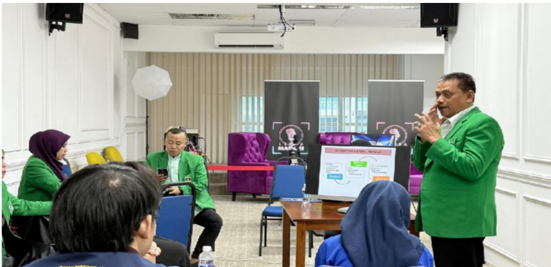
Gambar 1. Edukasi terkait kesehatan mental pada remaja re

Materi mengenai kesehatan mental remaja dipahami dengan baik. Peserta mampu mengidentifikasi faktor penyebab stres dan kecemasan yang mereka alami sehari-hari, seperti tekanan akademik, konflik keluarga, dan kesepian. Mereka juga belajar strategi coping sederhana yang bisa diterapkan, misalnya teknik pernapasan dan dukungan sosial.