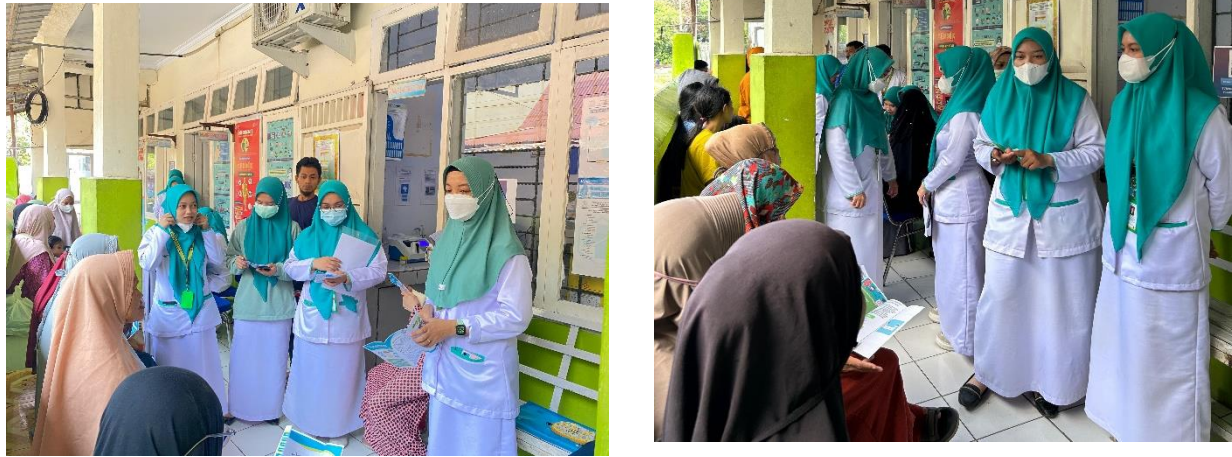
Gambar 1 Dokumentasi Kegiatan Penyuluhan Kesehatan

Hasil dokumentasi kegiatan penyuluhan di Puskesmas Maccini Sawah Kota Makassar