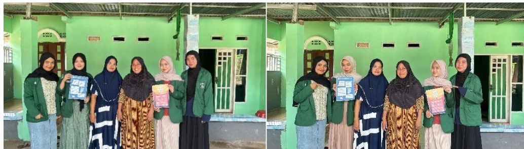
Gambar 2. Penyuluhan kotak P3K

Berdasarkan hasil pendataan, pada tabel 1 dijelaskan pemahaman mengenai perlunya kotak P3K disiapkan di rumah dan di kendaraan yaitu.