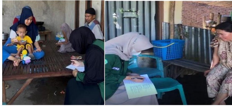
Gambar 1. Pengisian pre-test & post-test