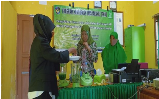
Gambar 1 : Penyuluhan Pencegahan Stunting

terhindar dari kejadian stunting yang biasanya daun kelor hanya dikonsumsi sebagai sayuran.