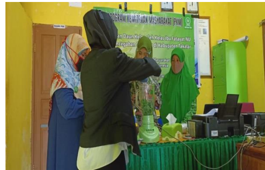
Gambar 2 : Pengolahan daun kelor menjadi jus kelor