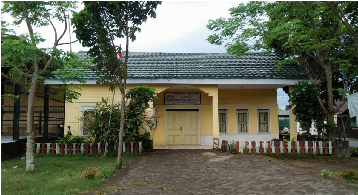
Gambar 1. Kantor Kepala Desa Mandalle

Pendidikan agama juga sangat penting dalam lingkungan pendidikan seorang anak. Pendidikan agama dapat berfungsi sebagai kontrol internal pada diri sang anak. Lingkungan keluarga harus bisa memberikan contoh perilaku yang baik kepada sang anak. Ubah lingkungan di mana sang anak itu tumbuh jadi lingkungan yang memberi teladan baik. Tempatkan ia dalam lingkungan yang memunculkan sifat-sifat baik dalam dirinya. Lingkungan inilah yang terutama membentuk lempung (anak) itu. Membangun karakter diperlukan juga semacam reward and punishment untuk sang anak, terutama di sekolah. Jika ia berlaku baik, beri semacam “hadiah” apa pun bentuknya, entah itu pujian atau apa pun. Jika ia berlaku buruk, beri juga ia hukuman. Lingkungan dan reward and punishment ini nantinya akan menjadi semacam kontrol eksternal (sosial) pada diri sang anak, yang lazimnya jauh lebih efektif ketimbang sekadar kontrol internal dalam membentuk karakter baik anak.