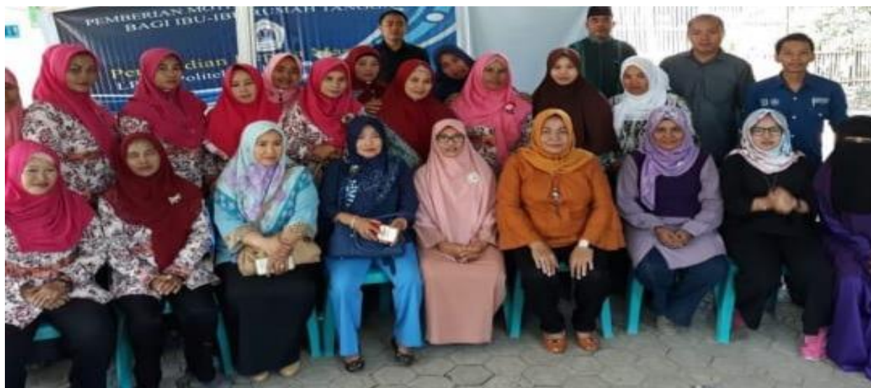
Gambar 4. Tim pengabdian bersama ibu-ibu PKK desa Mandalle

Karakter seorang individu terbentuk sejak dia kecil karena pengaruh genetik dan lingkungan sekitar. Proses pembentukan karakter, baik disadari maupun tidak, akan mempengaruhi cara individu tersebut memandang diri dan lingkungannya dan akan tercermin dalam perilakunya sehari-hari. Seiring dengan perkembangan zaman yang disertai dengan berkembangnya teknologi informasi telah mengakibatkan pergeseran nilai dan banyak perilaku menyimpang yang terjadi pada anak-anak, sehingga orangtua dan lembaga pendidikan serta lingkungan masyarakat perlu memberikan perhatian serius dalam membangun pendidikan karakter anak. Membangun pendidikan karakter anak harus dimulai sejak dalam kandungan dan sejak usia dini, karena usia dini adalah usia emas.