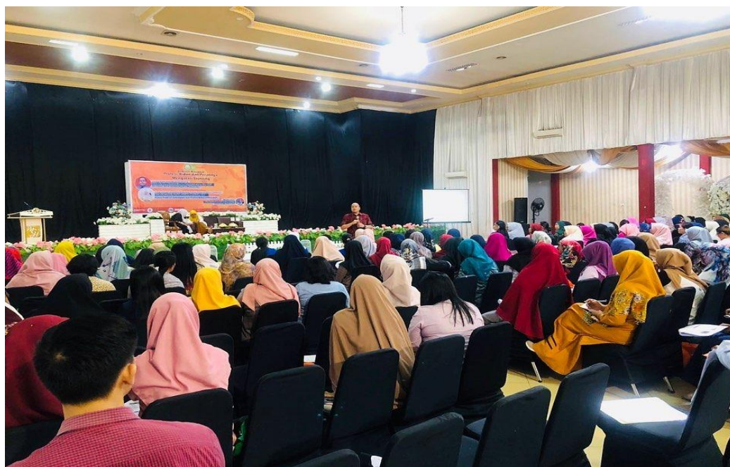
Gambar 2. Tim PkMD FK UMI melakukan seminar dalam rangka skrining ibu dalam mencegah dan mengatasi stunting