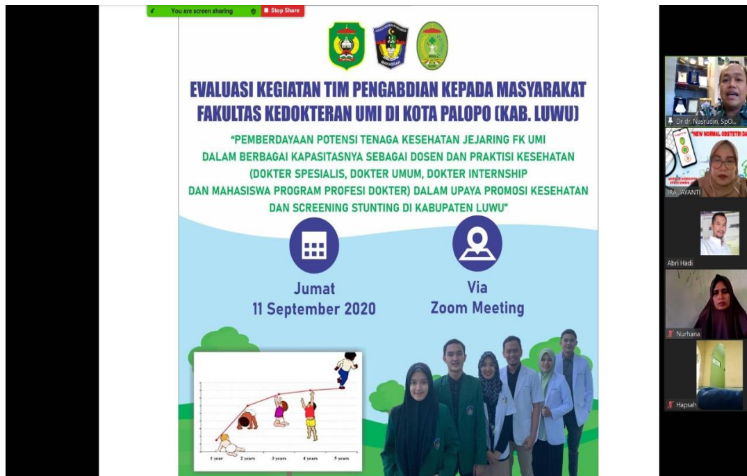
Gambar 3. Tim PkMD FK UMI melakukan evaluasi kegiatan yang dilakukan secara onlie yang dihadiri oleh peserta pada tahap I serta mitra Stikes KJP asal Kota Palopo, Sulawesi Selatan