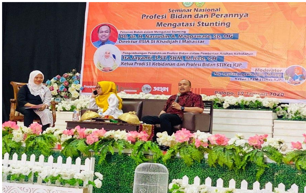
Gambar 1. Tim PkMD FK UMI bersama para pemateri dan Ketua Prodi S1 Kebidanan dan Profesi Bidan Stikes KJP asal Kota Palopo, Sulawesi Selatan